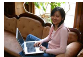
学校到处可以无线上网