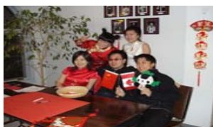
2008 年的春节联欢晚会。

蒙特爱利森大学的办学宗旨是“少而精”，目前每年只招 2200 名学生。其中国际学生为 8%，来自 45 个不同国家。2006 年开始面向中国招生，现有 50 多名中国学生。这样中国学生有更好的语言环境以提高他们的英语能力。2007 年设立的中国学生会旨在帮助中国新生适应在加拿大大学的新生活。在大学领导的支持和帮助下，中国学生会组织，召开系列活动，向当地加拿大人和在校学生介绍中国的传统文化。