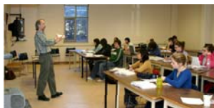
老师正在给学生们上课

学习： 学校提供优美的学习环境，舒适、安静、非常适合学习。小班上课，教师与学生的比例为 1: 15。25% 的理科学生有机会参加科研项目。