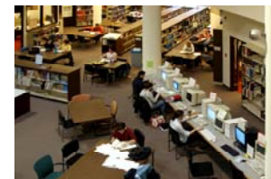
漂亮的校园图书馆